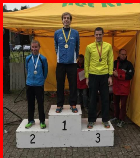
Podium seniors heren: